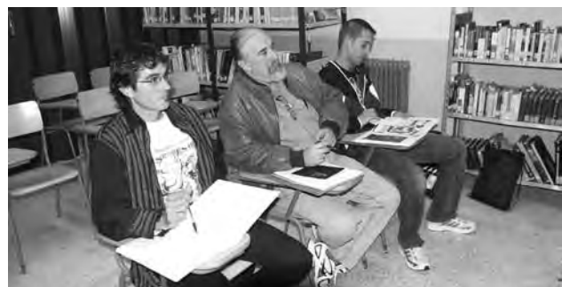
Tres de los miembros del 'Jurado en la sombra' toma apuntes mientras ve una sesión de cine en la prisión

La iniciativa surgió en colaboración con la Prisión Provincial de Soria. "Nos gustó la idea porque es una manera de que la gente sepa que los internos son parte de la sociedad y que pueden participar en cualquier tipo de actividad cultural", explica el director del centro.