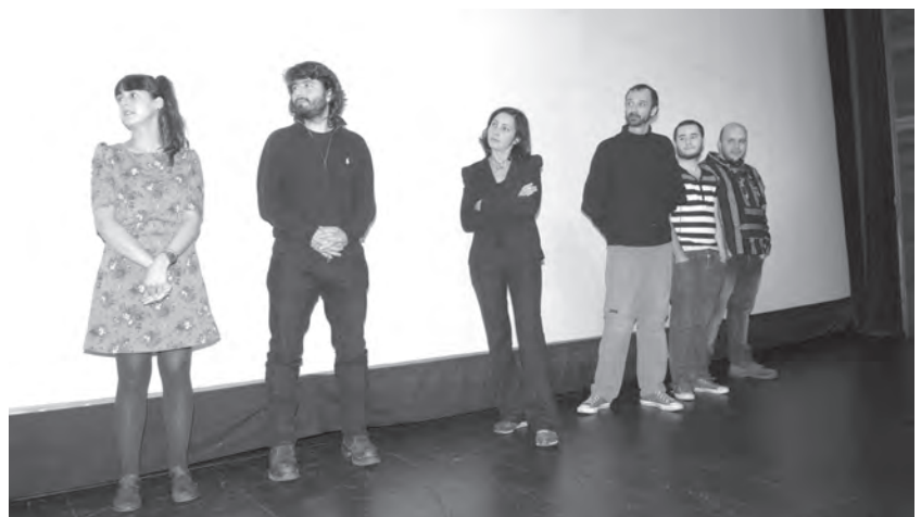
Cada director presenta su cortometraje en las sesiones a concurso