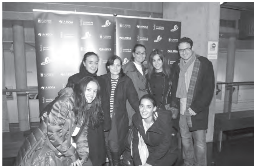
El equipo de 'Makomatica' visita Soria