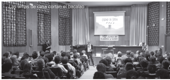
Las amas de casa cortan el bacalao