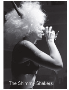
The Shimmy Shakers