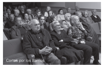
Cortes por los Barrios