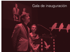
Gala de inauguración