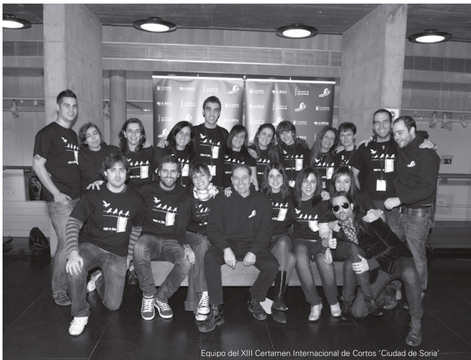
Equipo del XIII Certamen Internacional de Cortos 'Ciudad de Soria'