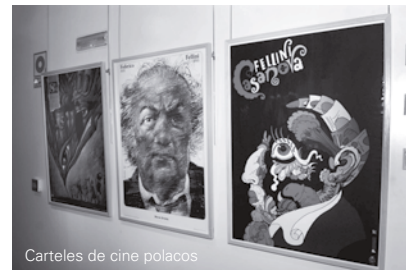
Carteles de cine polacos