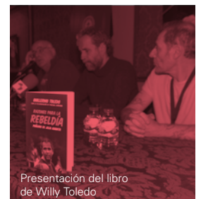
Presentación del libro de Willy Toledo