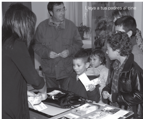
Lleva a tus padres al cine