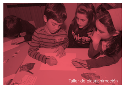
Taller de plastianimación