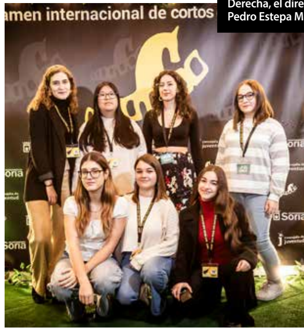
certamen internacional de cortos