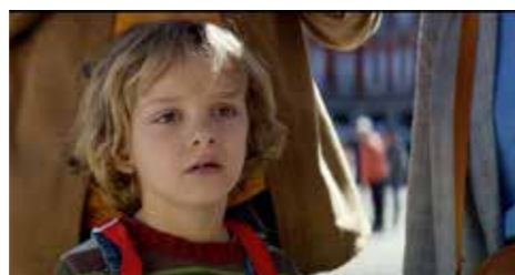
PREMIO MEJOR SONIDO Dotado con 250 € y Trofeo Caballo de Soria Céntrico - Luso Martínez • España