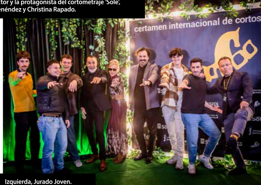
Izquierda, Jurado Joven. Derecha, algunos directores de la sección oficial en el photocall del Palacio de la Audiencia. Abajo, directores del III Concurso nacional de Videoclipis.