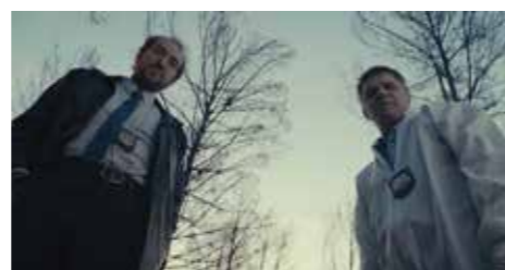
PREMIO COMPROMISO SOCIAL Y MEDIO AMBIENTE ATENEO JESÚS PEREDA Dotado con 800 € y Trofeo Caballo de Soria Donde se quejan los pinos - Ed Antoja • España