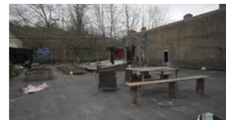
PREMIO "EN PRECARIO" Dotado con 200 € y Trofeo Caballo de Soria Hau etxea bada / Si esto es una casa - Nuria Casal • España